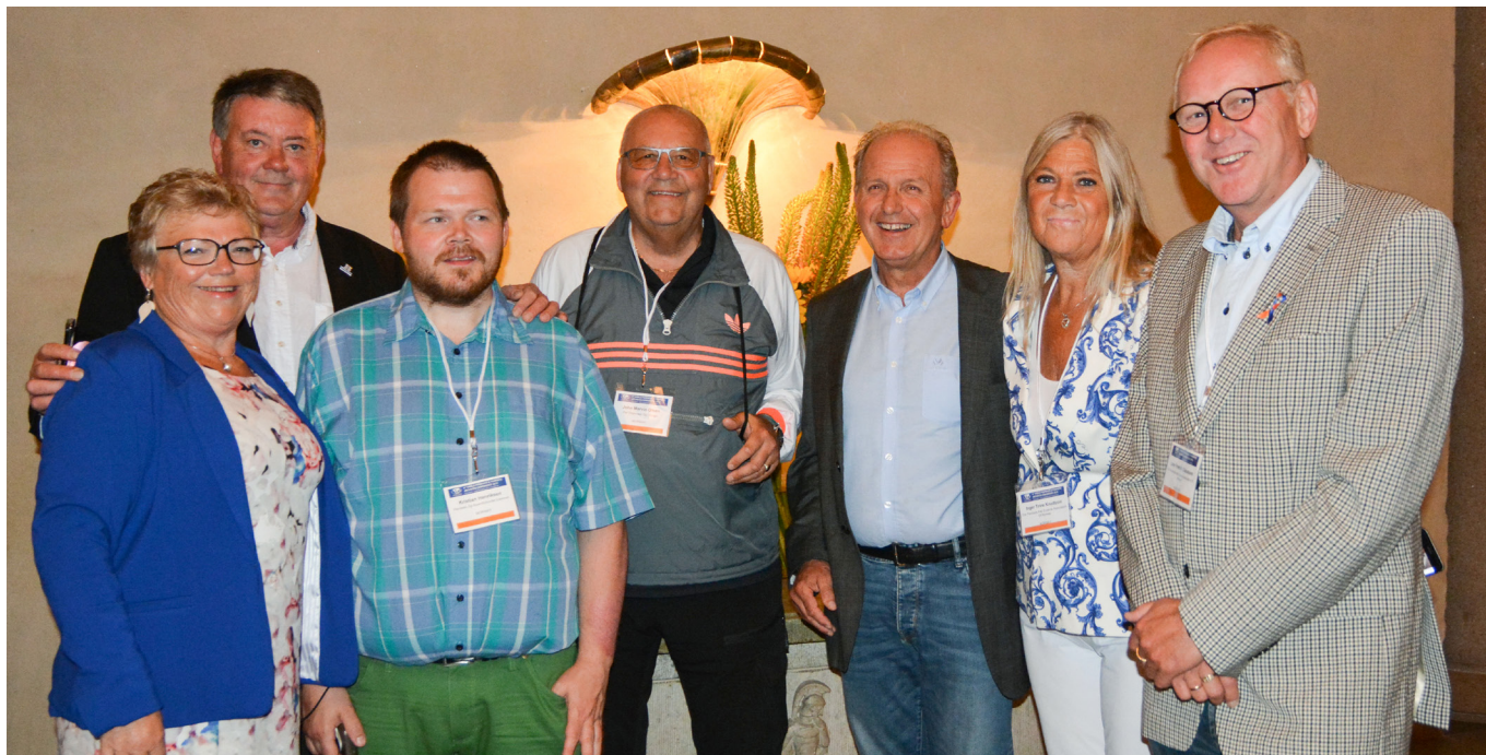
PEF-delegasjon i Stockholm.