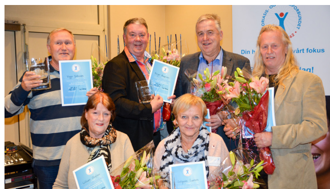
Hedersprisen, Landsmøtet 2015.

Psoriasis- og eksemforbundet fikk i anledning Landsmøtet tildelt gaver til en samlet verdi av kr. 148 990,60 fra lokale lag og nordiske søsterorganisasjoner. Gavene ble gitt til forskning, IKT/medlemssystem og «fritt bruk».