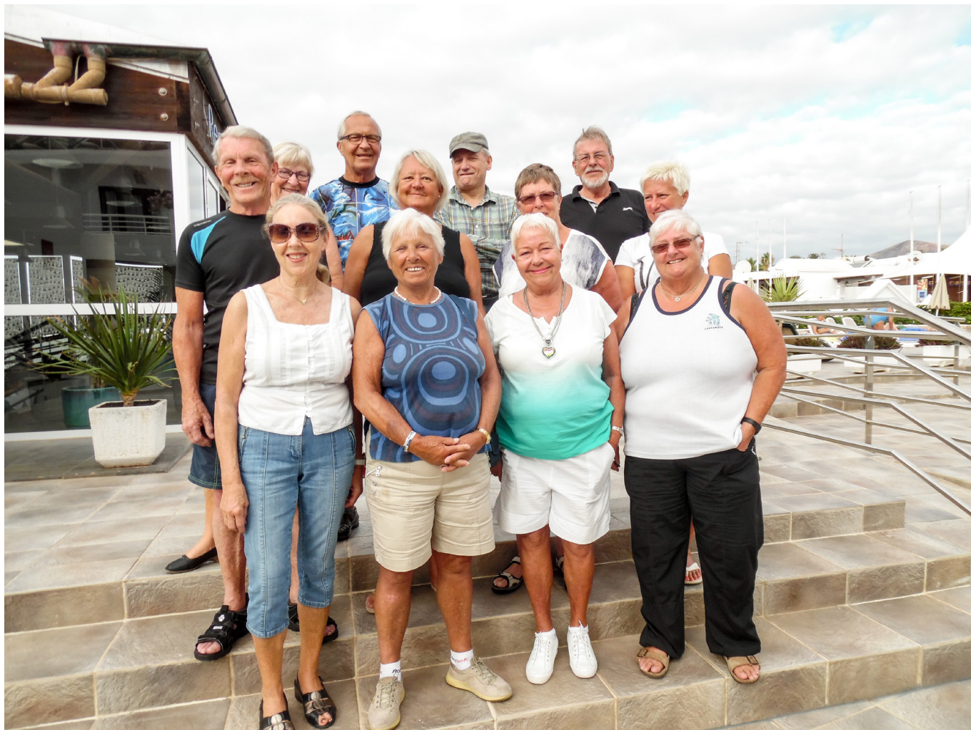
Reiseutvalgets tur til Lanzarote.