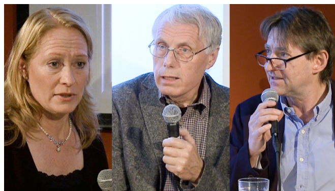
Paneldebatt, WPD Bergen.