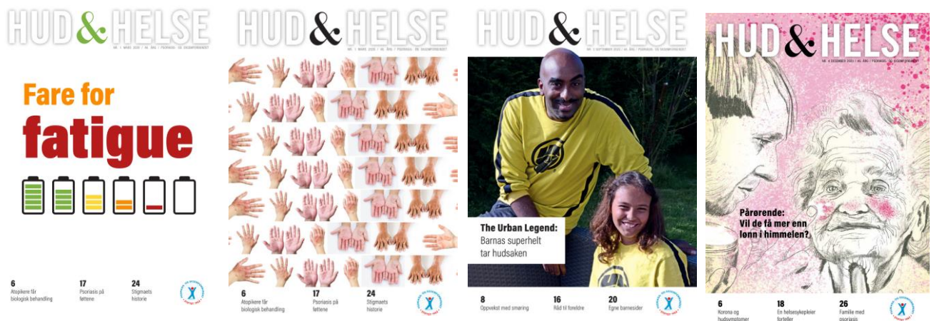
De fire utgavene av Hud & Helse i 2020.