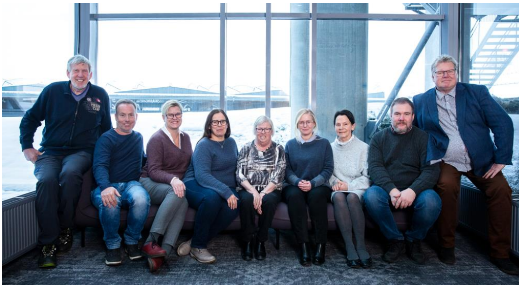
Sentralstyret i Psoriasis- og eksemforbundet 2018-2021.